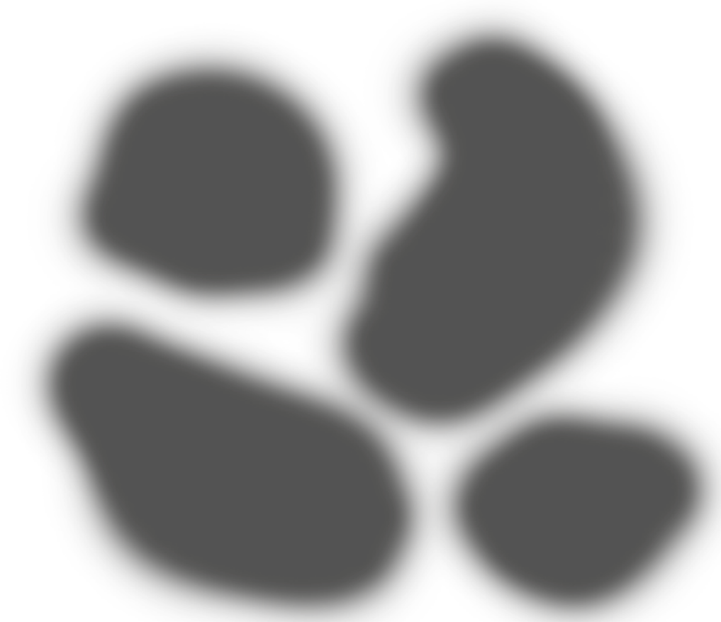
So sieht ein Mensch mit Diabetischer Retinopathie